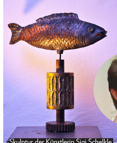
Skulptur der Künstlerin Sigi Schelkle